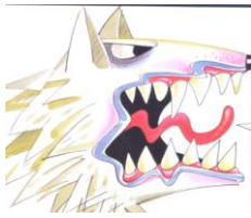
Figura 1: lobo tentando assustar