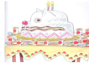
Figura 3: lobo tentando assustar

Um vão de mais de trezentos anos de história, de avanços tecnológicos, mudanças culturais instala-se entre as ilustrações de Maxfield Parrish, Walter Crane e Gustave Doré do século XIX e as apenas exemplificadas: da menina assustada das xilogravuras antigas à menina que vence seus medos “mais medonhos”. Ao pensar na imagem da Chapeuzinho na contemporaneidade percebemos várias mudanças de fisionomia: criança, adolescente, jovem ou idosa, sendo morena, ruiva, loira ou negra (usando chapéus de todas as cores), demonstrada por excesso de caricaturização ou simplesmente por garatujas. Para o lobo, o principal aspecto de mudança é a antropomorfização ao longo dos tempos: um lobo com feições animalizadas e grotescas cede espaço a um lobo ora satirizado ora vestido elegantemente, sempre bípede – do lobo pop-star de Ana Maria Machado ao lobo-bolo de Buarque. Mesmo os lobos que ainda encontram as Chapeuzinhos na floresta são ilustrados com paletós e muitas vezes gravatas e ganham as passarelas da moda no imaginário dos ilustradores com vestimentas que dão (assim como as botas ao Gato) status , um estado humanizado e requintado.