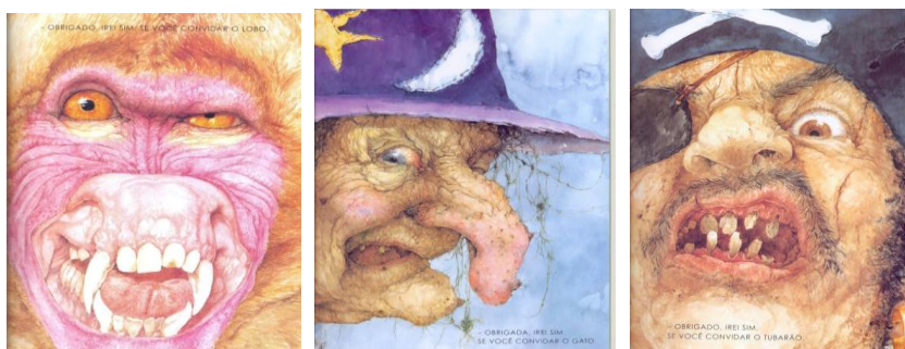
Figuras 5: o babuíno, a bruxa e o pirata

Márcio Seligmann-Silva (2005) relembra que na perspectiva da teoria poética clássica, mais precisamente com Aristóteles, o abalo promovido por cenas chocantes que geram no expectador sensações de pena ou de medo, pode ter uma consequência tanto prazerosa como útil. Não à toa a atração por cenas de violência ou tragédias incitam a curiosidade e fazem com que um aglomerado de gente se desloque perante um cadáver, um acidente de trânsito ou perante a cena de um crime. Em “Do delicioso horror sublime ao abjeto e à escritura do corpo” (p. 31-45), Seligmann-Silva traça um panorama sobre a teoria e os conceitos de sublime e a crise no paradigma sobre o belo e mais ainda sobre o “horror deleitoso” que, segundo Burker (1993, apud SELIGMANN-SILVA: 2005), proporciona deleite quando são atenuadas ou em nosso caso, residem apenas no imaginário.